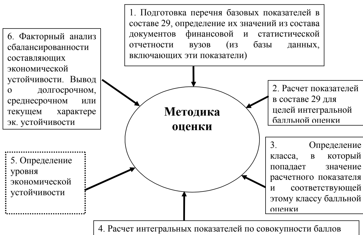
Рисунок 2. Алгоритм применения метода интегральных балльных оценок 6

Алгоритм применения метода интегральных балльных оценок представлен на рисунке 3. Он включает в себя 6 этапов (рисунок 6). Балльное значение расчетных показателей суммируется по каждому блоку и приводится к единой оценке с использованием весовых коэффициентов (рисунок 3). Вес суммарных баллов по каждому блоку экономической устойчивости устанавливается с целью элиминирования воздействия на результаты оценки такого фактора как разное количество показателей в каждом блоке (см. рисунок 2).