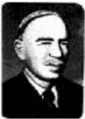
Дж. М. Кейнс

Творческая биография Дж. М. Кейнса. Его книга “Общая теория занятости, процента и денег”. Логика исследования. Психологический закон склонности к потреблению и сбережению.