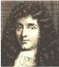
Жан Батист Кольбер

Меркантилизм - первая школа экономической теории. Две стадии развития меркантилизма. Экономические последствия великих географических открытий.