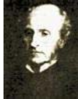
Джон Стюарт Милль.

Классическая политическая экономия во Франции . Ж.Б. Сэй и Ф. Бастиа. Экономическая теория в Англии . Т.Р. Мальтус, Н. Сениор. Завершение классической политэкономии. Джон Стюарт Милль и его работа “Основы политической экономики и некоторые аспекты их приложения к социальной философии”(1848).