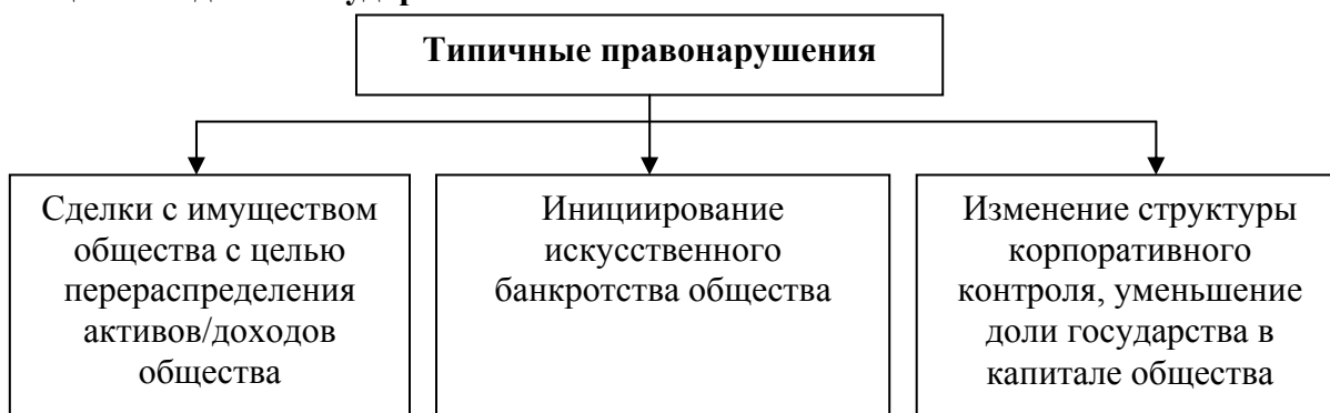
Схема 2. Типичные правонарушения в процессе деятельности акционерного общества с долей государства

и в области корпоративного управления и процедуры эмиссии. Типичные правонарушения в данных областях представлены на схеме 2.