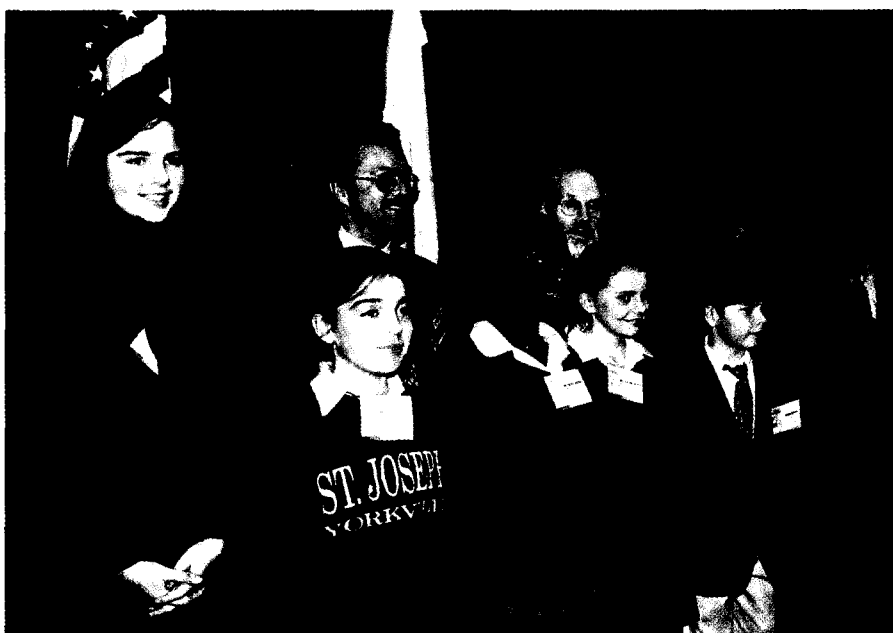
Президент НФБ Уильям Джонстон и руководитель ММВБ Александр Захаров с российскими и американскими школьниками при подписании совместного меморандума 21 ноября 1997 г.

Под руководством исполнительной команды Председателя Совета директоров НФБ Ричарда Грассо были предприняты значительные усилия для привлечения иностранных компаний к участию в торговом обороте НФБ. Акции свыше 350 иностранных компаний из почти 50 стран мира обращаются на НФБ, что составляет около 10% ее оборота. Более того, в 1997 г. из 279 новых видов ценных бумаг, допущенных к торгам на бирже, 63 (т.е. 23%) были выпущены иностранными компаниями. Миллионы людей просматривают таблицы НФБ в деловых разделах газет и наблюдают на экране телевизоров за работой операционного зала биржи в ежевечерних выпусках новостей. Однако многие ли действительно разбираются в том, как функционирует НФБ?