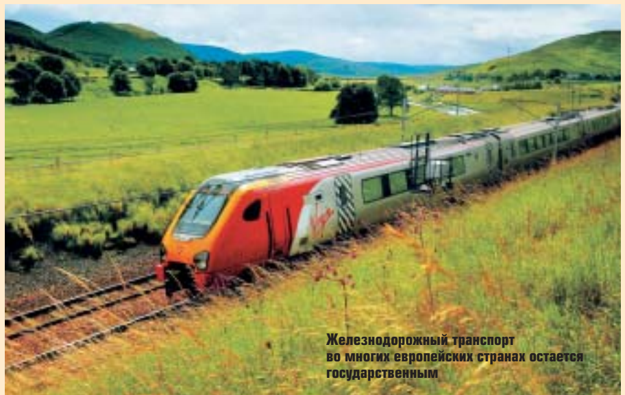
Железнодорожный транспорт во многих европейских странах остается государственным

номические «эксперименты» были приняты в Италии и Германии. Муссолини, мечтавший создать первое в мире «корпоративное государство», подчиненное «интегральному дирижизму», не только ввел в 1926 году 8-часовой рабочий день и 48-часовую рабочую неделю, обязательные санитарные нормы на предприятиях, пособия по болезни, безработице, уходу за детьми и т.п., но и создал семь контролируемых государством корпораций, в которых была сосредоточена вся экономическая жизнь Италии. Государство назначало управляющих этими корпорациями и координировало их деятельность с помо-