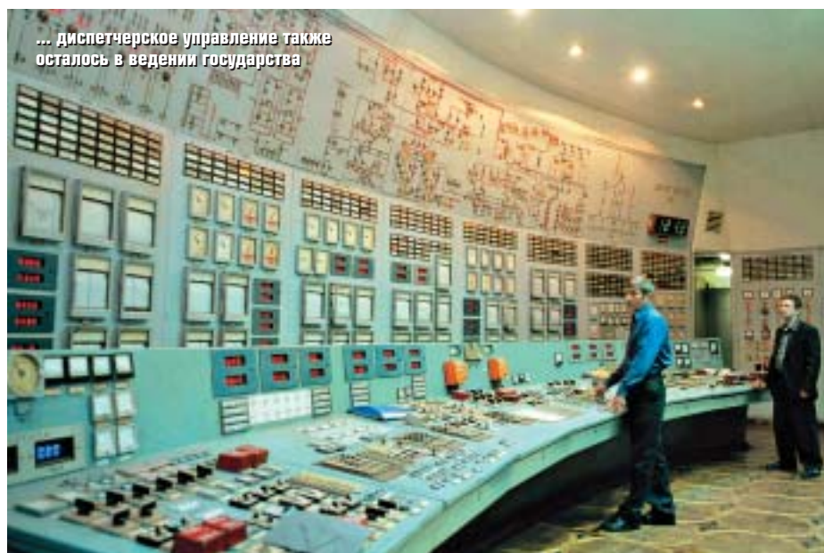
... диспетчерское управление также осталось в ведении государства

Сюда же примыкает и еще один аргумент государственников: государство должно активно участвовать в социально значимых отраслях — полностью отдавать их в распоряжение частного сектора и опасно, и несправедливо. Именно так рассуждали английские лейбористы, национализировавшие после Второй мировой войны в числе прочего угольную и сталелитейную промышленность, а также систему здравоохранения.