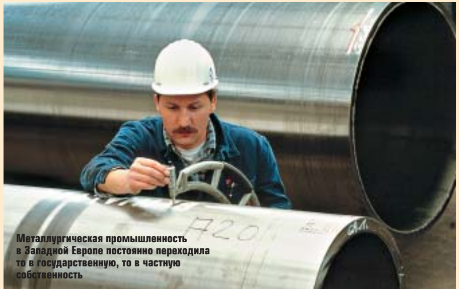
Металлургическая промышленность в Западной Европе постоянно переходила то в государственную, то в частную собственность