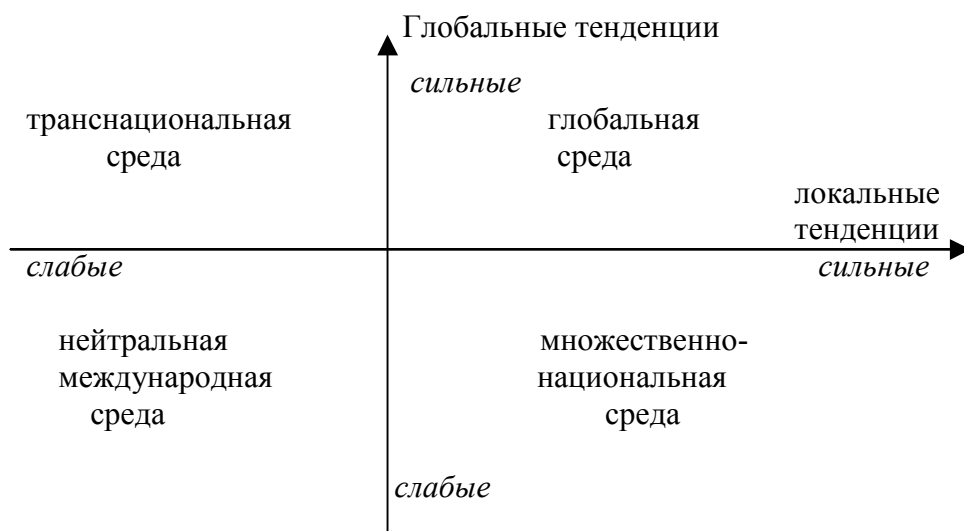
Рис.1. Анализ мирохозяйственной среды.

Таким образом, мирохозяйственное взаимодействие формируется под воздействием не только глобальных, но и локальных сил. Представим эти две тенденции в виде условной схемы анализа мирохозяйственной среды (см. рис.1). В плоскости двух координат (вертикальная ордината – глобальные тенденции и горизонтальная ордината - локальные тенденции) лежат многие возможные виды, формы и методы мирохозяйственного взаимодействия. Как минимум четыре варианта мы можем рассмотреть.