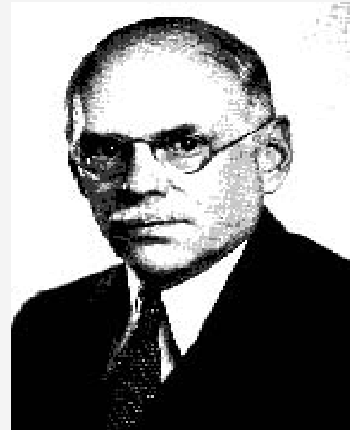
Фрэнк Х. Найт