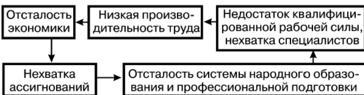
Рис. 14.4. «Круг отсталости» Б. Кналла

Идея «порочных кругов», сложившихся в слаборазвитых странах, была подхвачена другими учеными. Проследить их логику можно на следующих схемах (рис. 14.4 и 14.5).