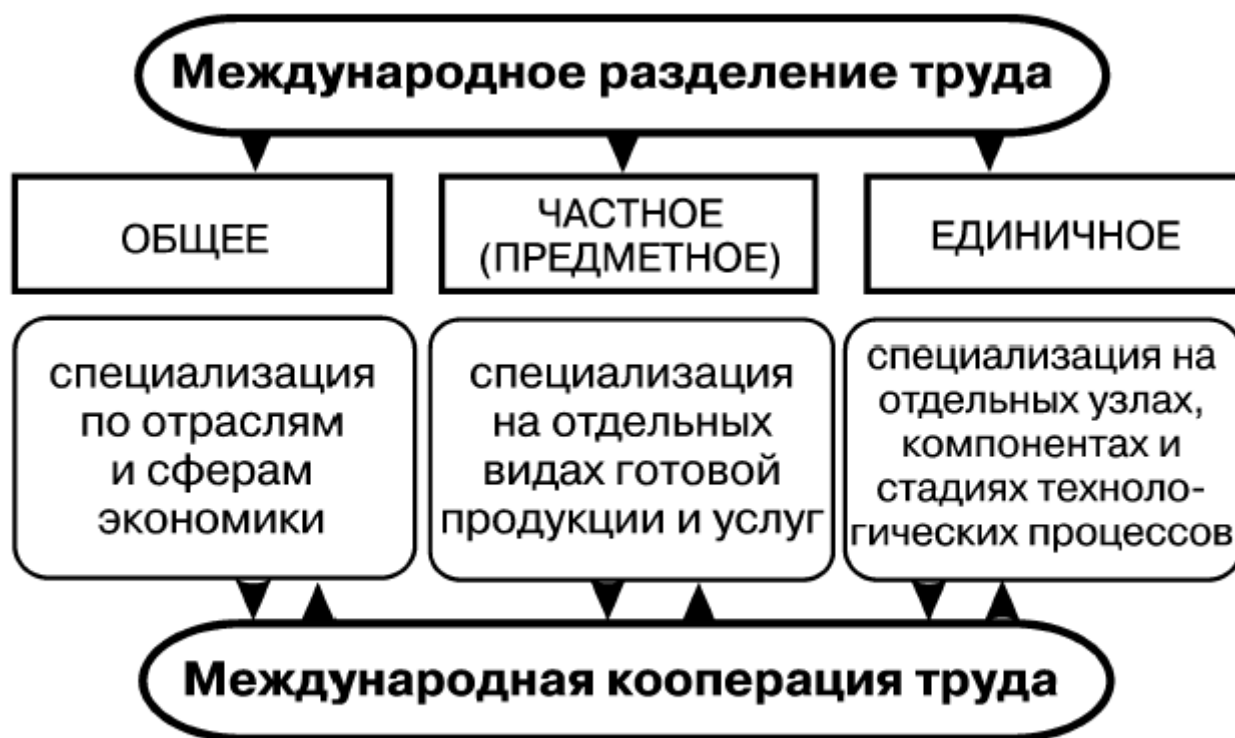
Рис. 14.2. Формы международного разделения труда

специализация по отраслям и сферам экономики называется общим МРТ ; специализация на выпуске отдельных видов готовой продукции и услуг называется частным МРТ , или предметной специализацией; специализация на производстве отдельных узлов, на стадиях технологических процессов называется единичным МРТ .