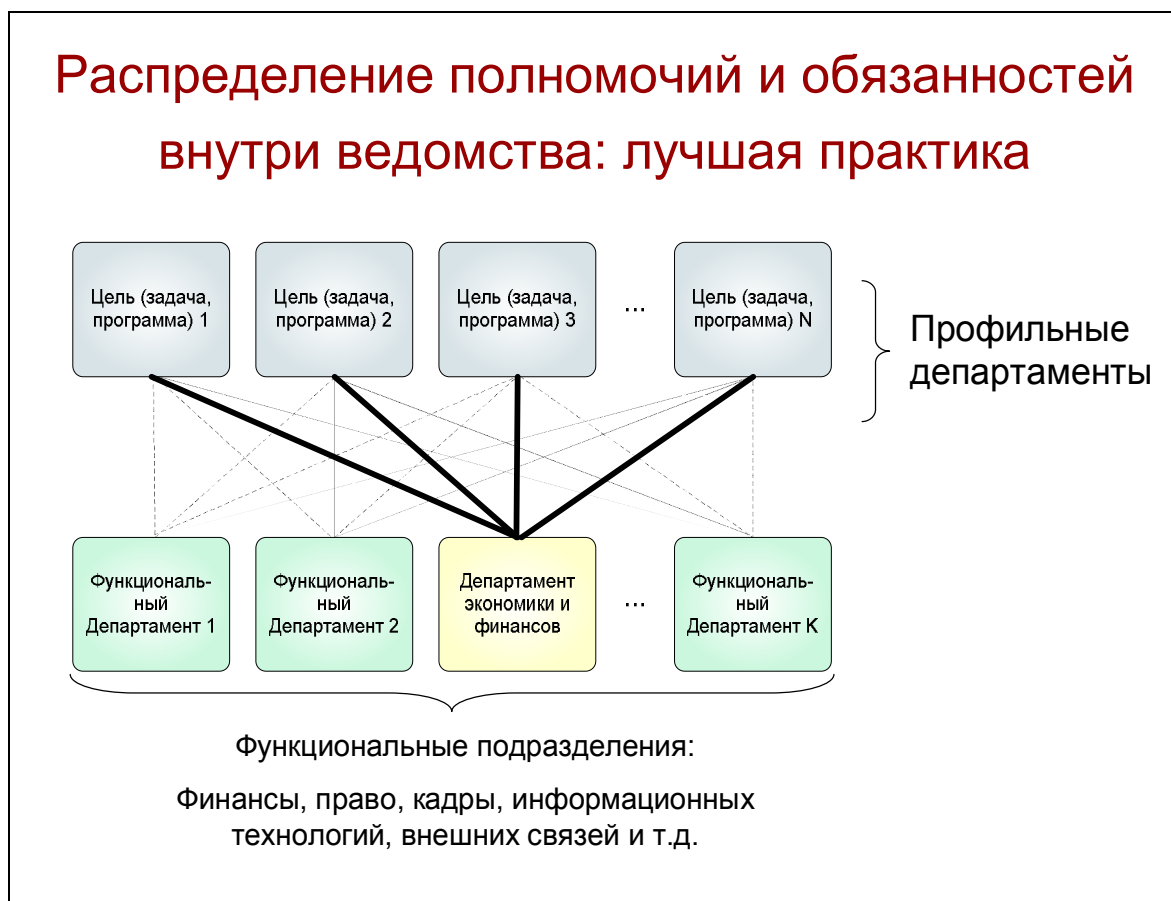
Рис. 1.2. Распределение полномочий и обязанностей внутри ведомства: лучшая практика

Необходимо установить четкие правила, регулирующие отношения в сфере финансового менеджмента между различными уровнями иерархической структуры государственных органов, в том числе отчетность и обмен информацией. Для обеспечения эффективного функционирования системы управленческой подотчетности в министерствах и ведомствах назначается руководитель, который будет непосредственно подотчетен высшим органам исполнительной и законодательной власти, отвечая за организацию и качество финансового менеджмента в своей организации. В странах, где министр является политической фигурой, этот руководитель в министерствах занимает высшую исполнительную должность. Для выполнения своих функций он должен быть наделен соответствующими полномочиями и обладать высокой степенью управленческой свободы, чтобы эффективно управлять различными системами возглавляемой им организации и контролировать их действие в целях достижения наилучших результатов в рамках имеющихся ресурсов. К его функциям также относится обеспечение оптимального делегирования полномочий и обязанностей по финансовому менеджменту на основе законодательства и с учетом специфики деятельности организации.